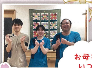
お母さん いつも ありがとう