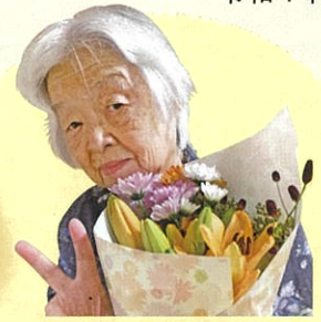
手先が器用で 習字もお得意な〇様 毎日活発に過ごされています。