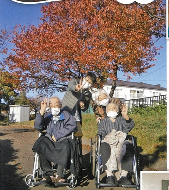
すっかりと葉が 赤くなっていました