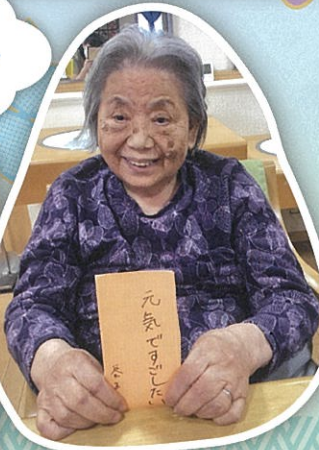
願いごと 空まで届け~