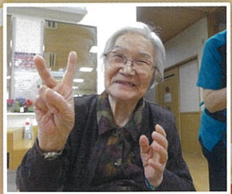
秋の大運動会 負けないぞ~